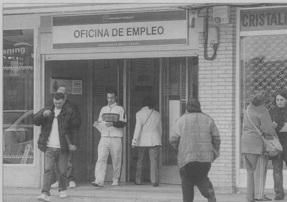
Oficina pública de empleo en la Comunidad de Madrid.

Estas entidades deben rendir cuentas sobre su eficacia. Para ello están obligadas a enviar mensualmente una serie de indicadores, como el número de personas atendidas, especificando cuántos perceptores de desempleo; las ofertas y demandas captadas y gestionadas, así como su resultado (incluyendo el número de contratos suscritos), entre otros. Todo esto se evaluará cada dos años para mantener o suspender el convenio de colaboración.